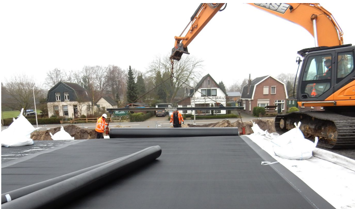
Foto: Aanbrengen HDPE-folie.