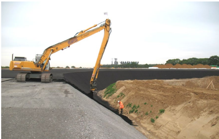
Foto: Aanleg van zandbentonietpolymeergel.