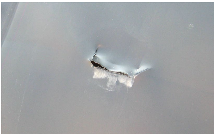
Foto: Beschadiging folie.