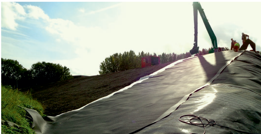
Foto: Overzicht aanleg IBC-werk.