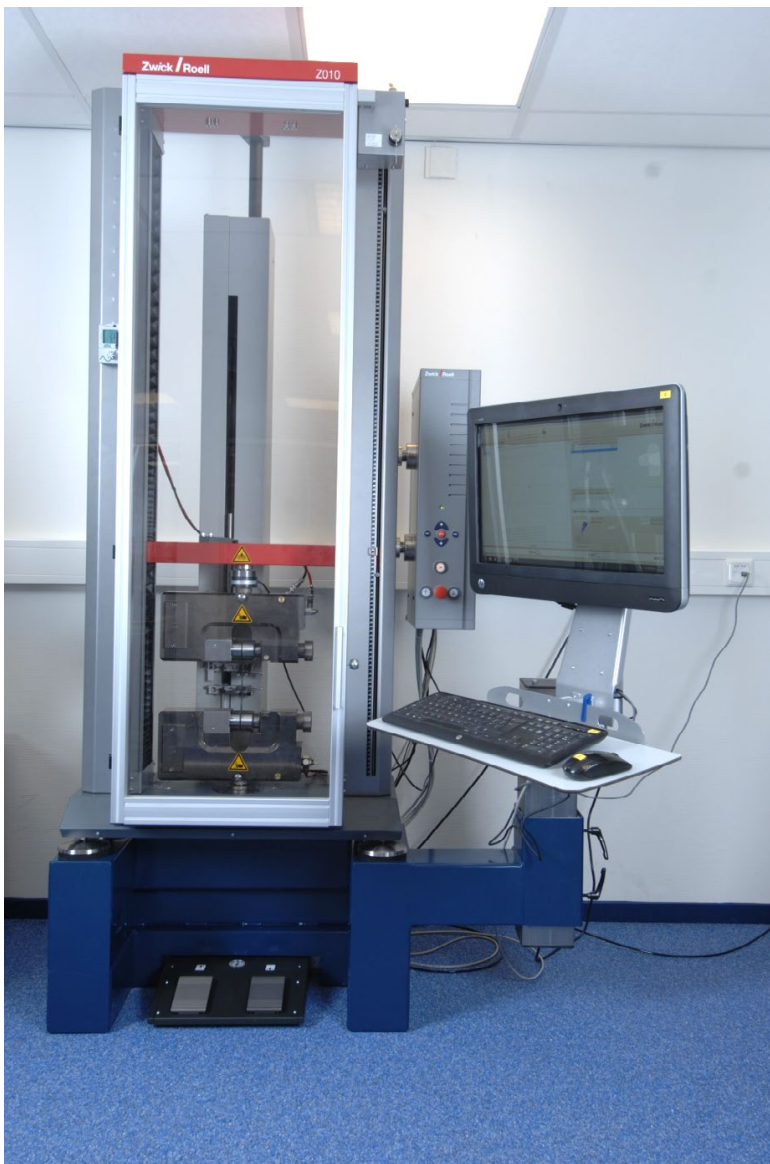
Foto: Trekbank (o.a. apparatuur voor bepalen afpelsterkte lasverbindingen).