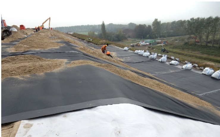
Foto: Aanbrengen geotextiel en HDPE-folie.