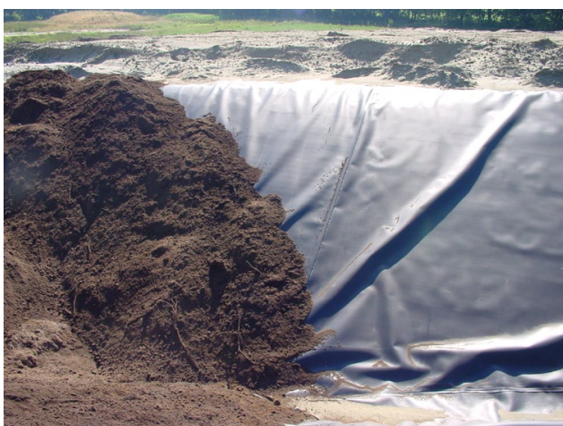
Foto: Folie belasten wanneer het niet strak ligt (o.a. uitzetting in de zon).