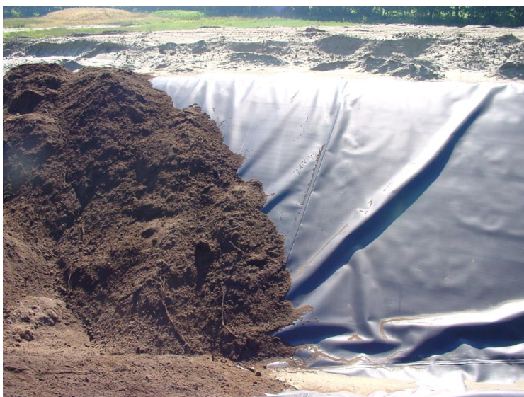
Folie: Belasten wanneer het niet strak ligt (o.a. uitzetting in de zon).