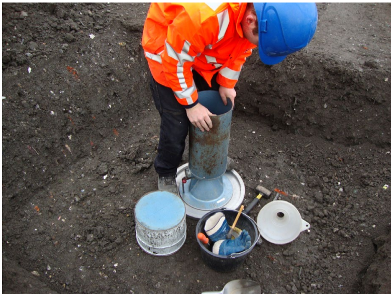
Foto: Bij 4.2 en 4.3: Meting verdichting AEC bodemas en bepalen verdichtingsgraad.