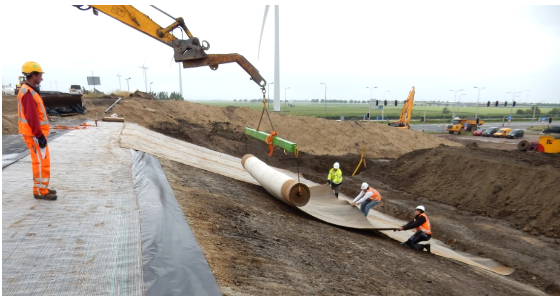
Foto: Toepassing bentonietmat.

Om beschadigingen aan de voorziening te voorkomen, hebben niet-destructieve onderzoeks- en meetmethoden de voorkeur. Meetmethoden die niet in dit protocol zijn voorgeschreven, zijn toegestaan wanneer de inspecteur zich ervan heeft overtuigd dat hij hiermee een betrouwbare kwalificatie van de voorziening kan verkrijgen.